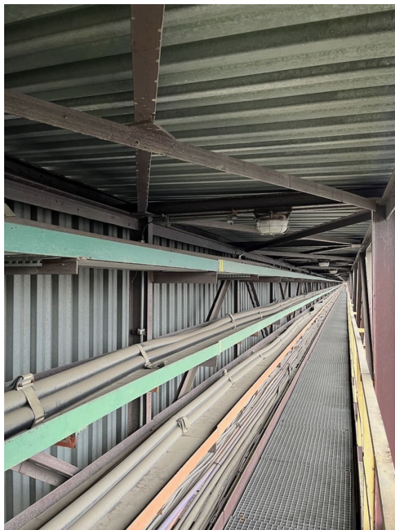
1- uložení kabelů na mostě bez kabelových příchytok, nebo závěsů