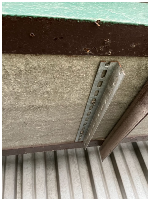
3-textilní pásy na kabelových lávkách jsou připevněné pouze k cementovláknovým podkladním deskám