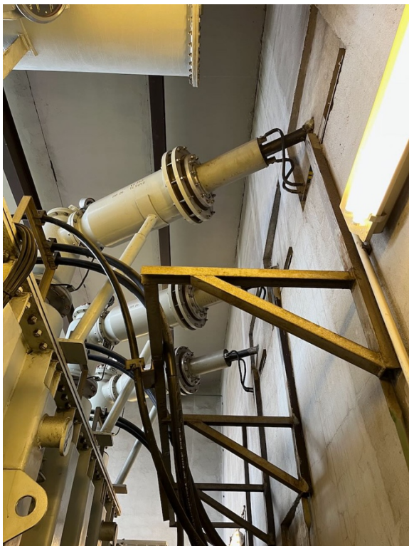
2- ukončení kabelového vedení u T113, kabelové koncovky Silec